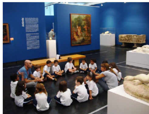
Visitas agendadas de fim de semana