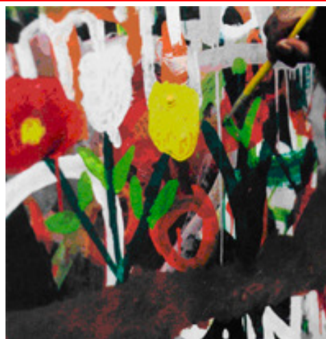
Ateliê do MASP