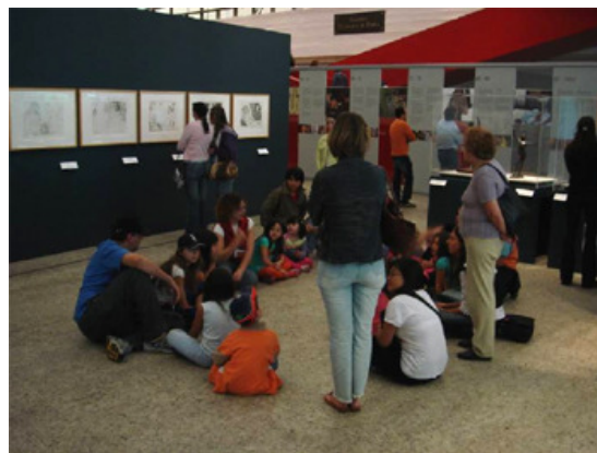
Visitas Temáticas para o Público Visitante