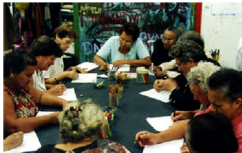
Assessoria ao professor

Atividade destinada a crianças até 10 anos de idade. Ao se tornarem associadas ao Clube as crianças recebem em primeira mão notícias referentes às atividades empreendidas pelo Serviço Educativo do MASP. Novas inscrições são recebidas diariamente de 3ªs a 6ªs férias. Mais informações sobre o programa pode ser obtido no site do Masp www.masp.art.br na página do Serviço Educativo.