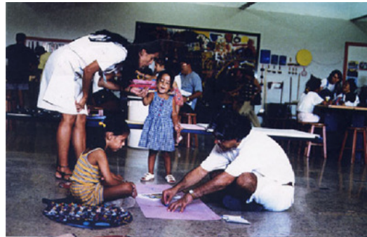
Ateliê para FAMÍLIAS